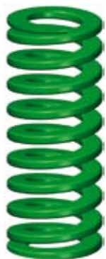
1. Низкая нагрузка